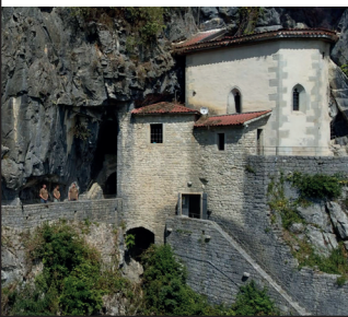
Grotta di San Giovanni d'Antro - Pulfero (UD) - www.grottadantro.it